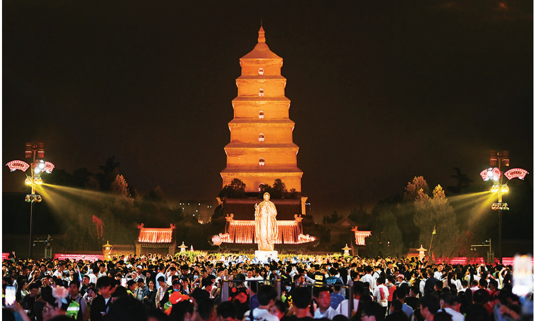
游客在西安大唐不夜城步行街游览(5月1日摄)。

“随着促消费政策进一步发挥效力,消费对于经济的拉动会继续显现。同时,基础设施投资和制造业投资有一定韧性,也会对扩大内需逐步发挥作用。”国家统计局新闻发言人付凌晖说。