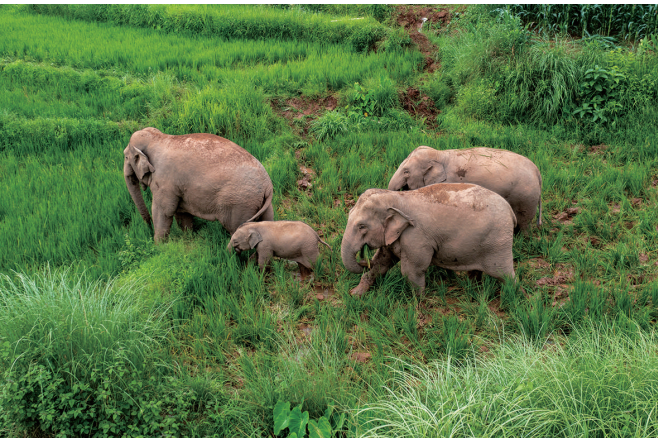
7月19日,四头野生亚洲象在普洱市江城县一处稻田里觅食。