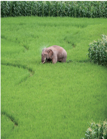
这是7月19日在云南省普洱市江城县拍摄的亚洲象。