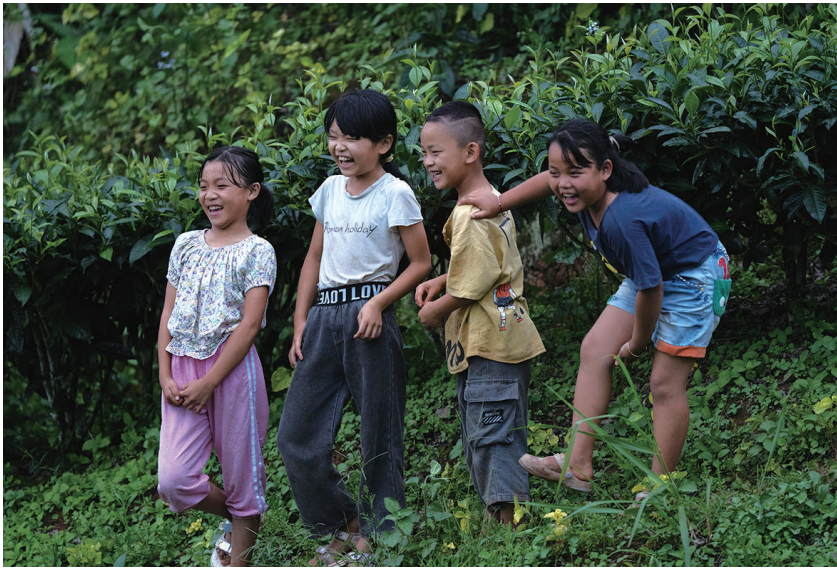
7月19日,小朋友在远处遥望象群。