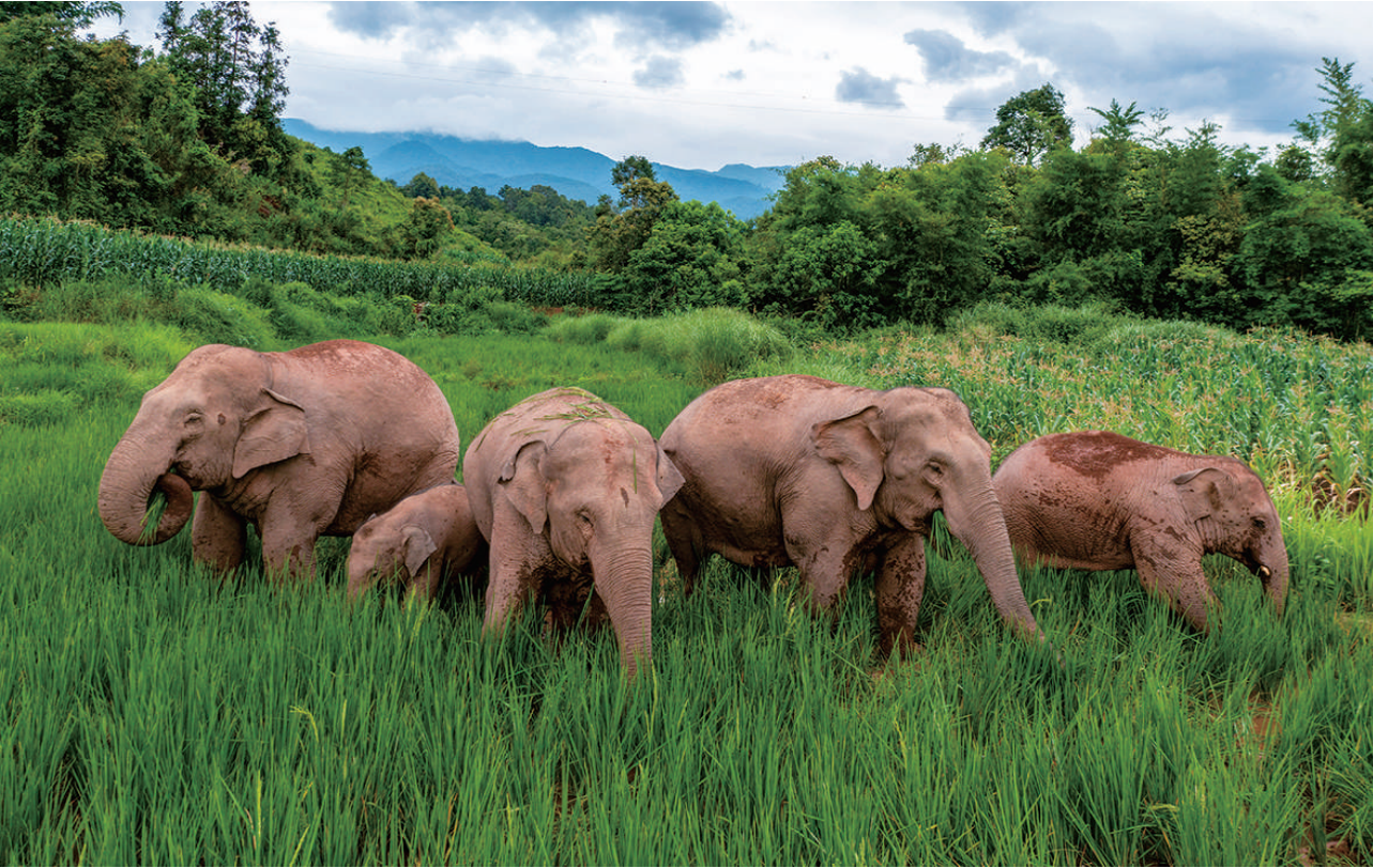
7月19日,几头野生亚洲象在普洱市江城县一处稻田里觅食(无人机照片)。