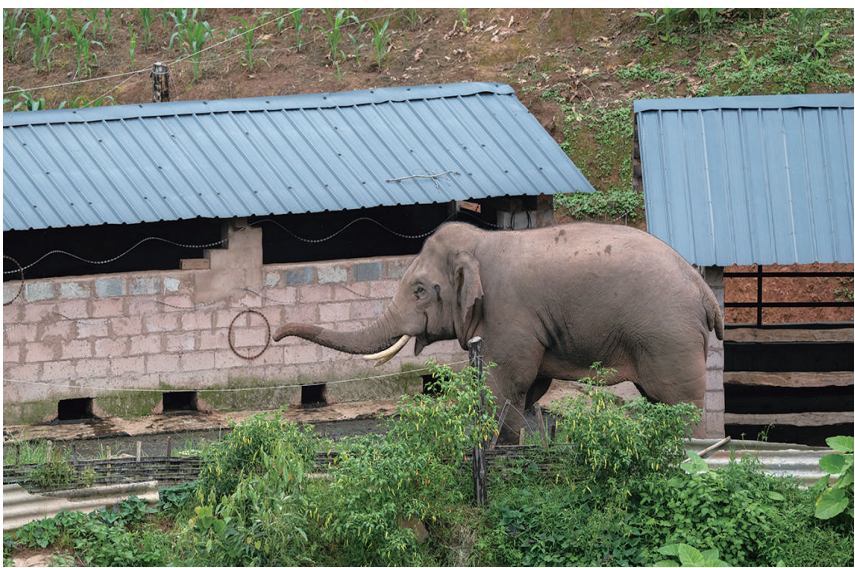
7月19日,一头雄性亚洲象“摸进”村民的牛棚。