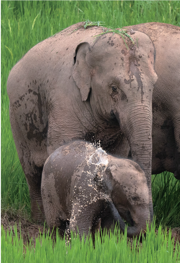
7月19日,一头小象在稻田中玩水。