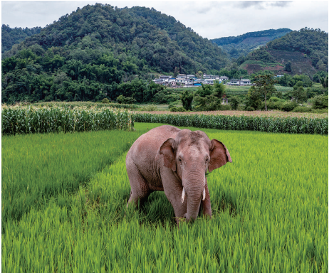
7月19日,一头野生亚洲象在普洱市江城县一处稻田里觅食。