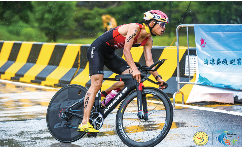
运动员在比赛中尽展“铁人”魅力。