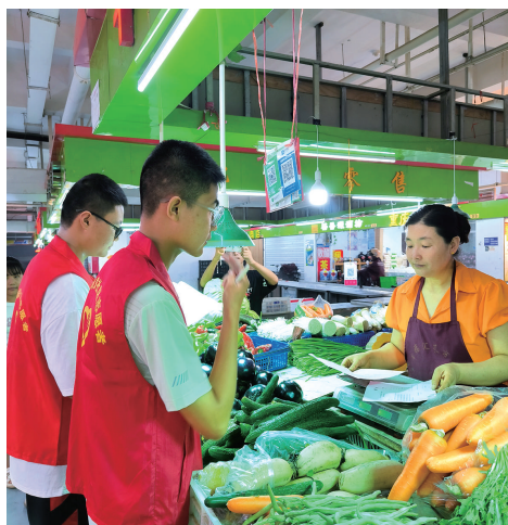
青少年志愿者配合社区人员发传单。

本报讯(记者 王丹 通讯员 梁慧云 文/摄)当前正值多种蚊虫繁殖的高发时段,为有效预防和控制病媒传染病的发生和传播,8月11日,小店街道真武南路社区组织物业、社区党员、青少年志愿者,开展“爱国卫生齐参与”宣传活动,还进行了卫生大清理。