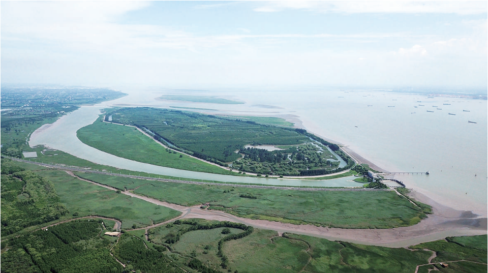
这是2023年7月25日拍摄的上海崇明西沙湿地公园(无人机照片)。

两年多前，同样在江苏，习近平总书记在南京主持召开全面推动长江经济带发展座谈会时指出：“要保护好长江文物和文化遗产，深入研究长江文化内涵，推动优秀传统文化创造性转化、创新性发展。要将长江的历史文化、山水文化与城乡发展相融合，突出地方特色，更多采用‘微改