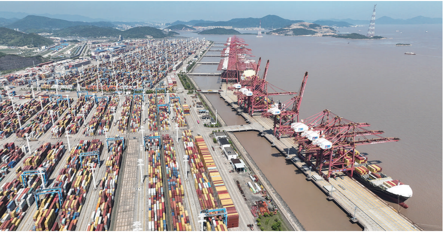
货轮停靠在宁波舟山港穿山港区装卸货物(2023年5月9日报，无人机照片)。

2016年在青海，强调“必须担负起保护三江源、保护‘中华水塔’的重大责任”；2020年在安