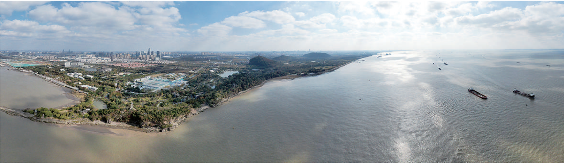
这是2020年11月13日拍摄的江苏省南通市五山及沿江地区景色(无人机全景照片)。