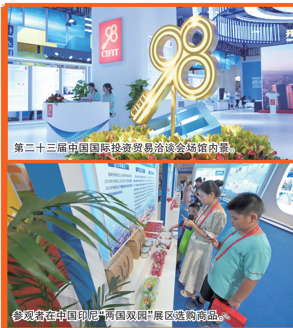
第二十三届中国国际投资贸易洽谈会场馆内景。