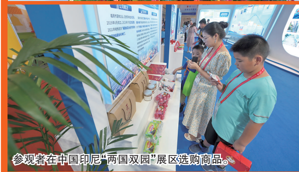
参观者在中国印尼“两国双园”展区选购商品。