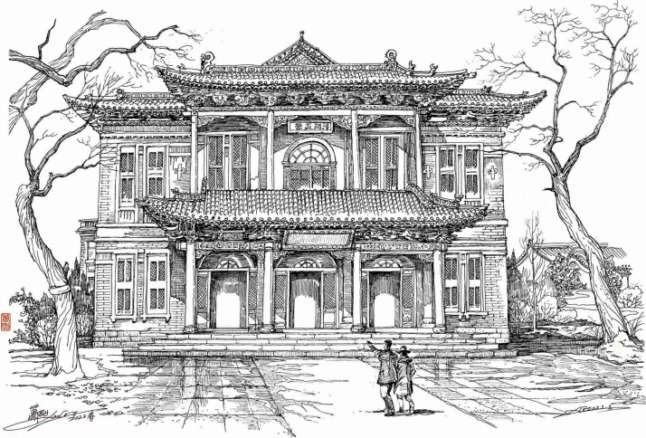
晋商博物院渊谊堂 萧 刚

晋商文化蕴绵长，百载风云庭院藏。梅塔依然风物异，乐章新启见辉煌。精神八字含凝重，典册万余留韵芳。天下汇通惊举世，唯缘诚信谱鸿章。 *乐章：指晋商博物院六个展馆。 *典册万余：指御书楼藏有明清到民国古籍善本1.2万余册，近4万卷。 *精神八字：指晋商精神，信、义、诚、勤、俭、和、开、创。