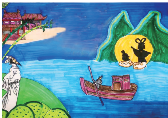
望月怀远 唐·张九龄