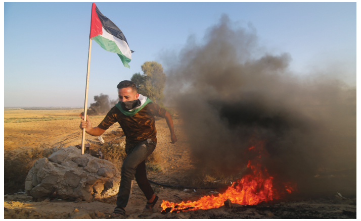
9月19日,在加沙地带南部加沙与以色列边境围栏附近,巴勒斯坦抗议者参与示威活动。

据巴勒斯坦媒体报道,以色列军队19日在约旦河西岸北部杰宁地区和加沙地带与巴勒斯坦人发生冲突,3名巴勒斯坦人在冲突中被打死。