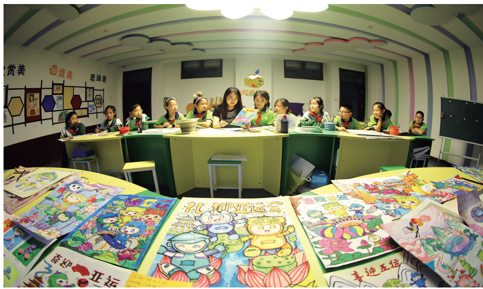
9月20日,小店区恒大小学开展“童心迎亚运”主题活动。孩子们用绘画、剪纸等作品,展现了迎接亚运会的喜悦之情。张昊宇 摄