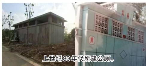
上世纪80年代所建公厕。

在环境卫生科学研究方面,1984年,成立了太原市市容环境卫生科学研究所,主要从事对城市固体废物无害化处理的相关技术研究、城市生活垃圾的环境卫生常规性监测等工作,是山西省唯一的环境卫生科研机构,也是国内主要从事环境卫生专业科研机构之一。