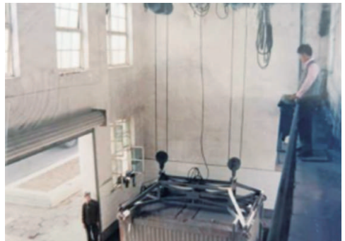
从上世纪90年代起,太原市学习北京、天津等地做法,大规模建设吊装式垃圾中转站,逐步建立街办一级收集、区环卫队二级转运、市环卫局负责终端处置的机制。