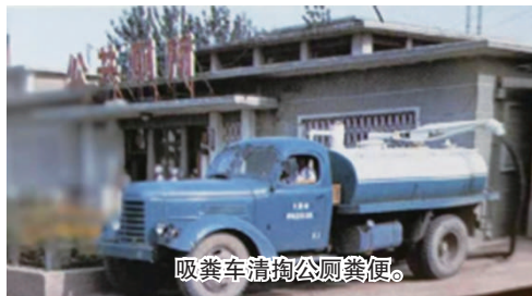
吸粪车清掏公厕粪便。