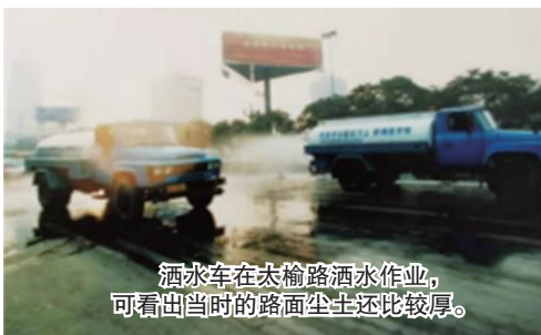
洒水车在太榆路洒水作业,可看出当时的路面尘土还比较厚。