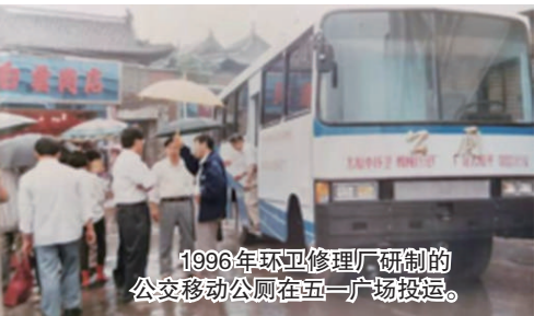
1996年环卫修理厂研制的公交移动公厕在五厂广场投运。