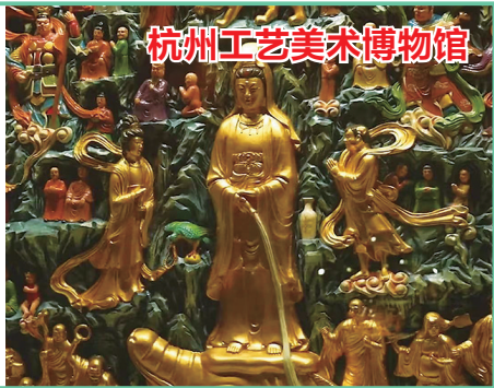
杭州工艺美术博物馆

杭州工艺美术博物馆(中国刀剪剑、扇、伞博物馆)坐落于中国大运河畔,杭州拱宸桥西历史街区内,是国家一级博物馆。杭州工艺美术博物馆群建筑是城市兴起和发展的重要历史见证。杭州工艺美术博物馆荟萃“手工艺之都”的精髓,集中呈现杭州工艺美术的发展历史,成绩斐然的艺术成就,向世界打开了解杭州工艺美术的窗口。