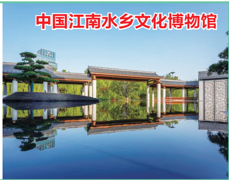
中国江南水乡文化博物馆

在杭州有一座区县级博物馆里面藏着一个“真正的”江南水乡,这就是中国江南水乡文化博物馆。博物馆位于临平区南苑街道南大街95号,是一座既反映临平历史,又以闻名于世的良渚文化为切入点展示中国江南水乡文化和民俗风情的博物馆,是人们了解良渚文化、临平历史,解读临平和整个江南水乡文化现象及其成因的重要窗口。