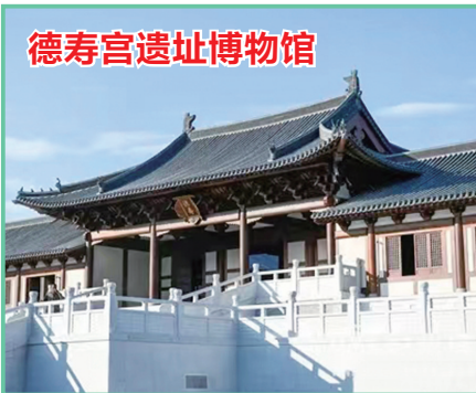
德寿宫遗址博物馆

德寿宫遗址博物馆位于杭州望江路北、中河中路东,方志馆东北侧,2022年11月18日,南宋博物院(一期)南宋德寿宫遗址博物馆对外开放。南宋德寿宫遗址博物馆是依托德寿宫遗址原址,以遗址本体及出土文物的保护、研究、收藏和展示为主,同时展示南宋历史文化和文物遗产的遗址专题博物馆。