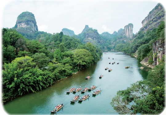
游客在福建省武夷山国家公园九曲溪乘船游览。