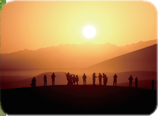
游客在甘肃省敦煌市鸣沙山月牙泉景区观赏日出。