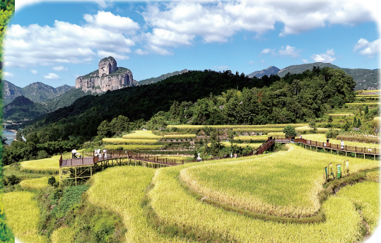
游客在浙江省乐清市白石街道中雁村梯田间观光。