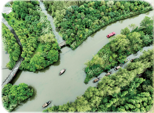
游客在江苏省泰州市姜堰区溱湖国家湿地公园乘船。