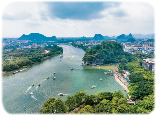
在广西桂林市,游客乘船游览漓江。