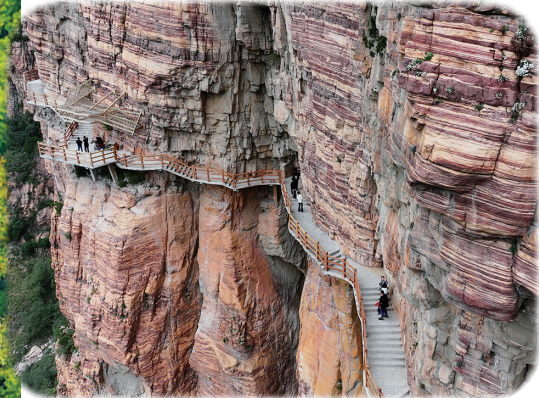
游客在河北省武安市东太行景区观光。