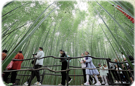
游客在山东省临沂市沂南县铜井镇竹泉村竹林栈道游玩。