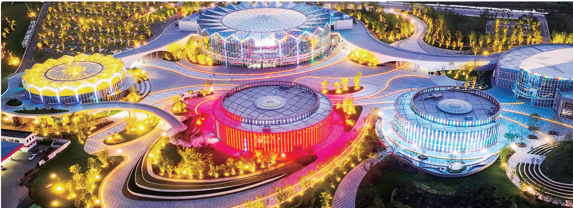
沭阳县华东花木大世界夜景