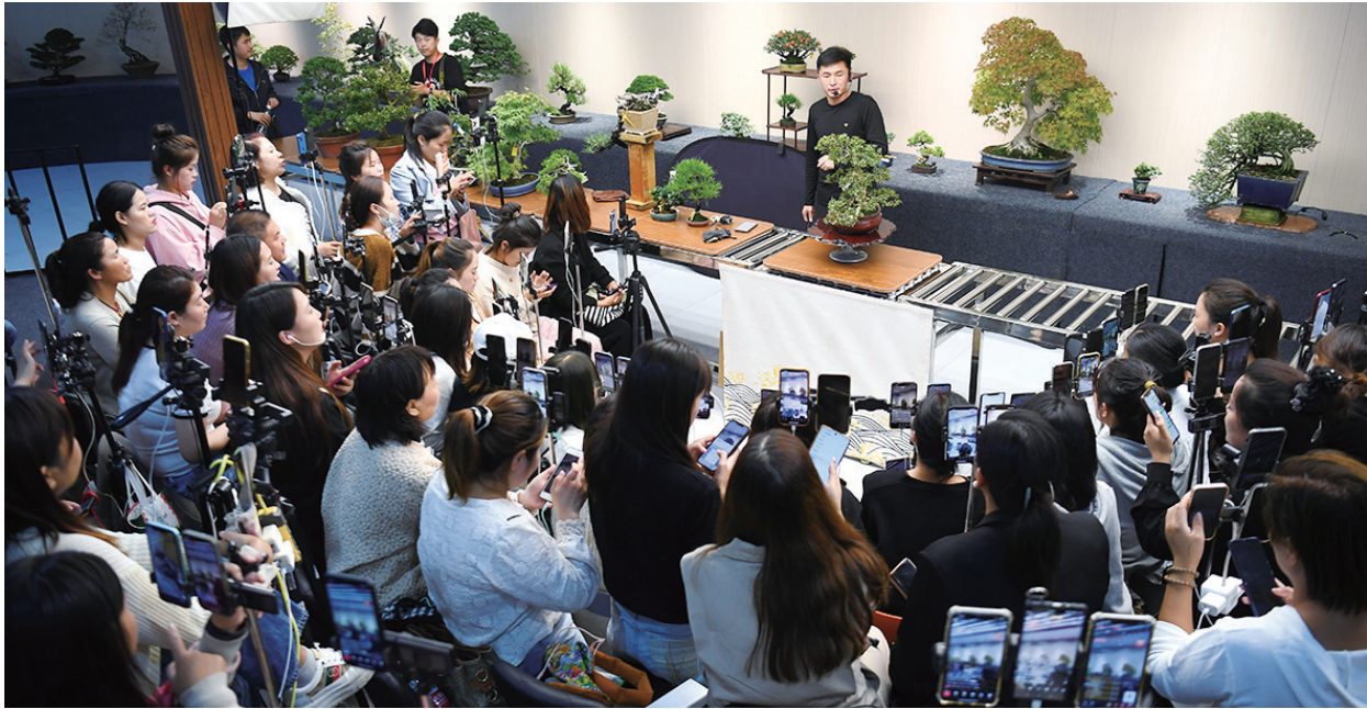
“矩阵直播”拍卖盆景场面震撼