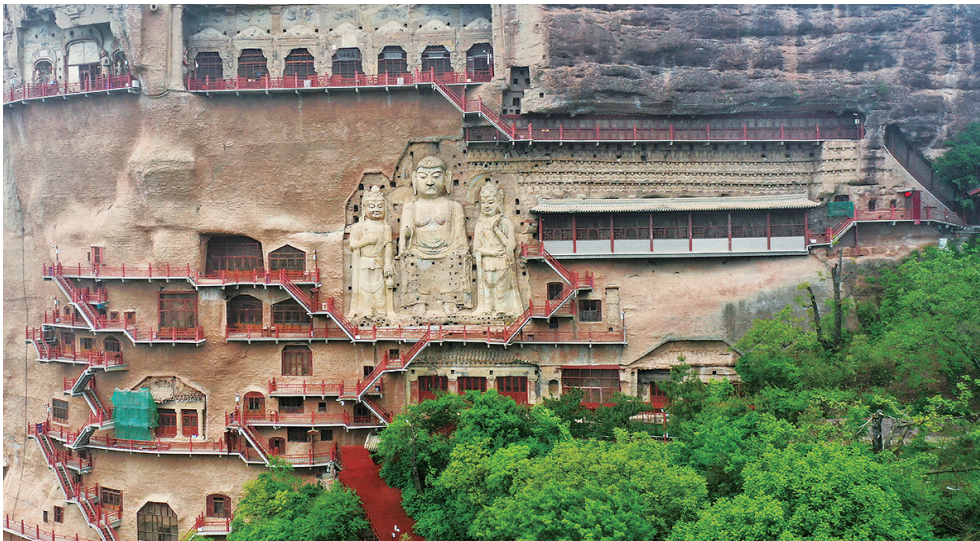
这是2022年4月29日在甘肃省天水市拍摄的麦积山石窟。