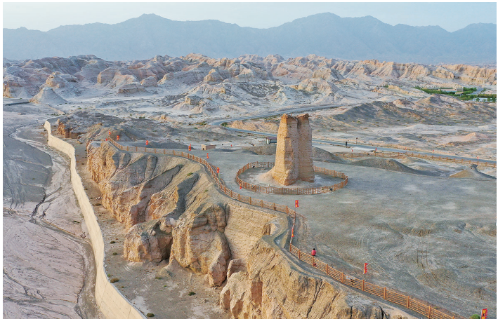
这是9月8日在新疆库车市拍摄的克孜尔尕哈烽燧。