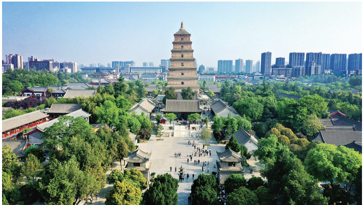
这是4月19日拍摄的西安大雁塔。