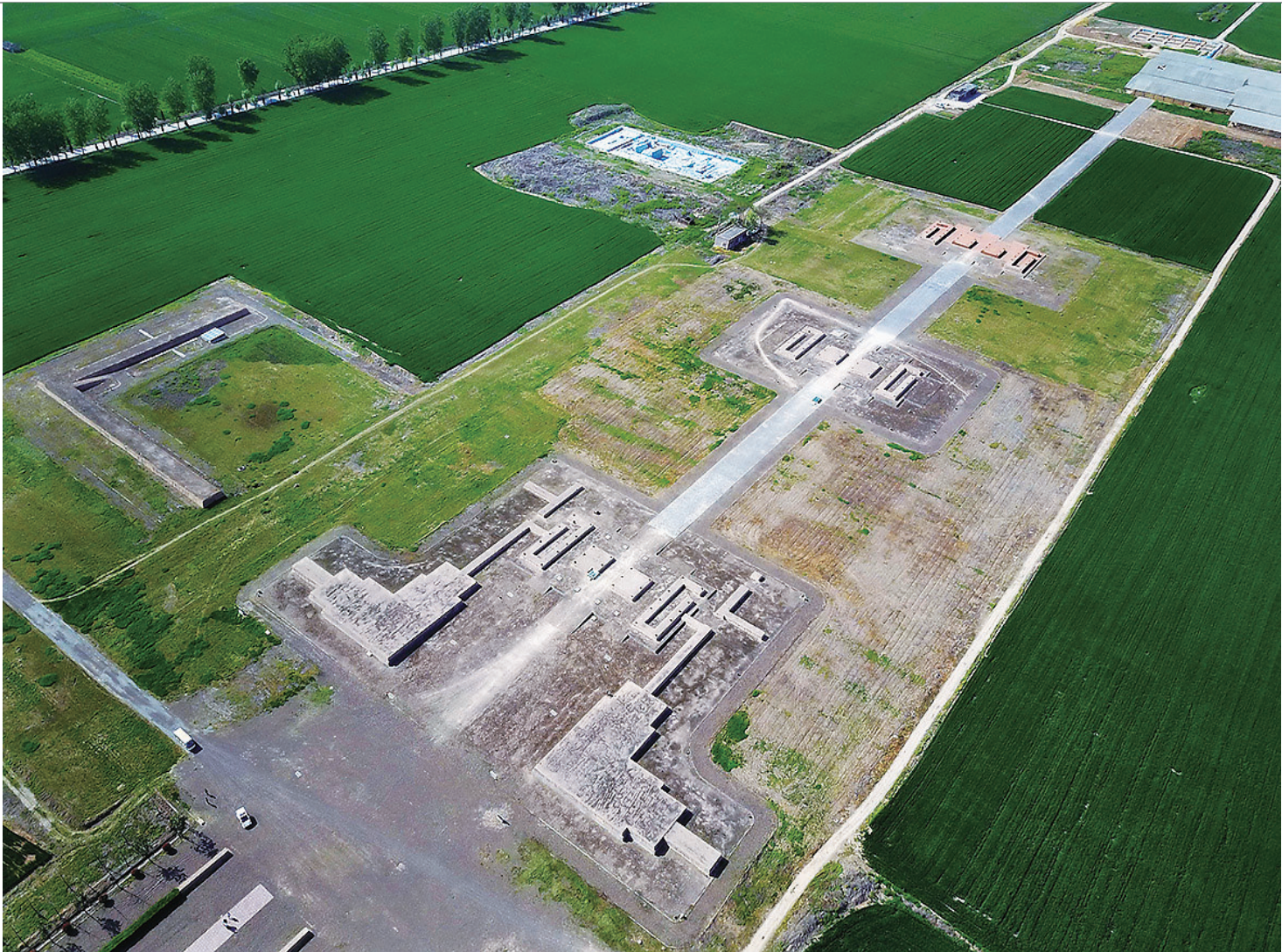
这是2017年4月21日拍摄的河南汉魏洛阳城遗址。