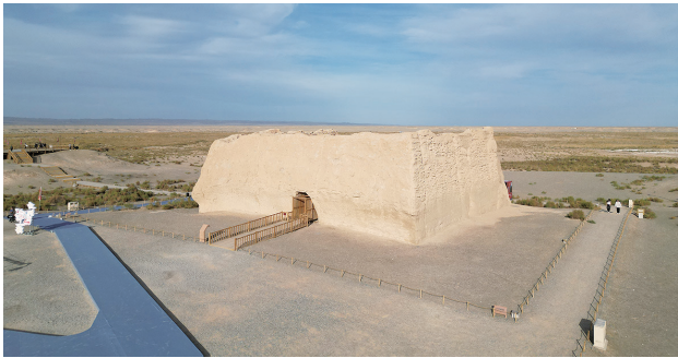
这是10月15日在甘肃省敦煌市拍摄的玉门关遗址。