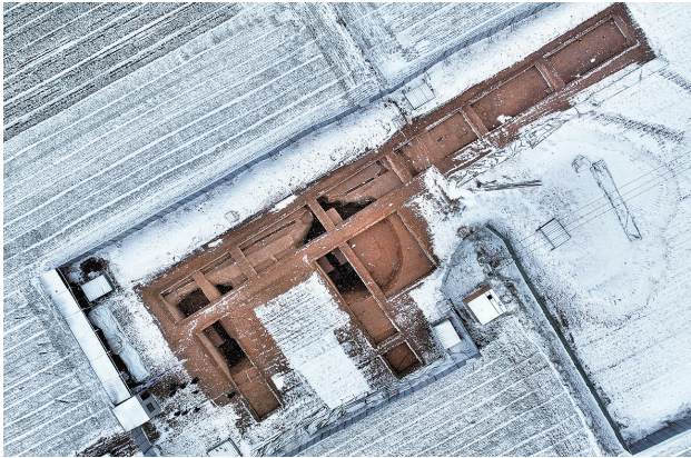
1月14日,河南汉魏洛阳城宫城遗址的宫城东墙发掘区全景。