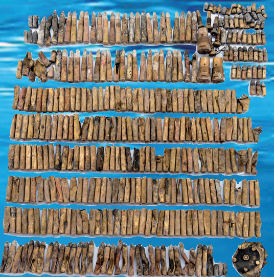
威海甲午沉舰遗址出水的部分小口径子弹合照