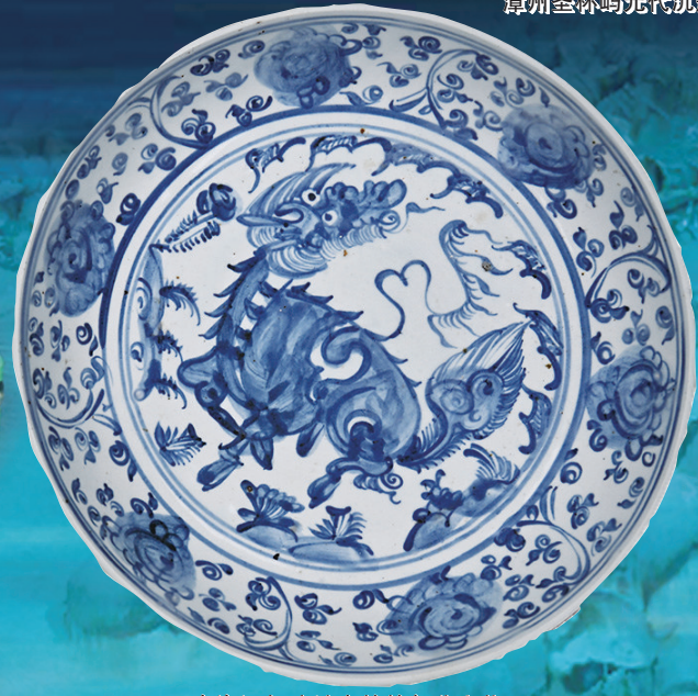
南海沉船遗址中的的部分文物