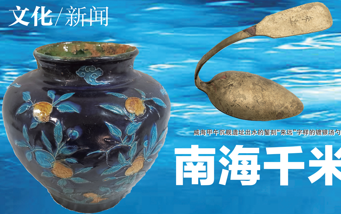
从沉船遗址提取出的珐华罐