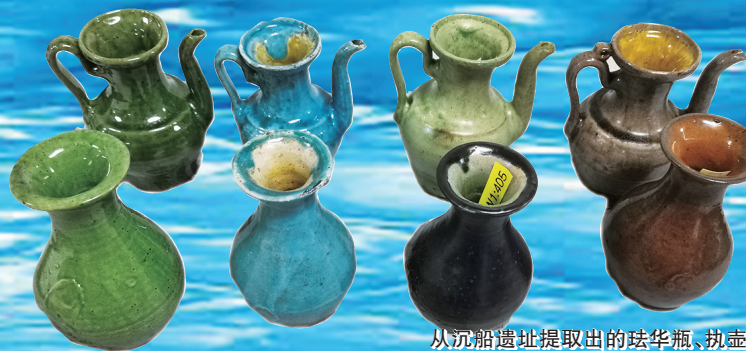
从沉船遗址提取出的珐华瓶、执壶

南海西北陆坡一号、二号沉船遗址发现于2022年10月,根据国家文物局的统筹部署和工作安排,2023年5月至6月、9月至10月,国家文物局考古研究中心、中国科学院深海科学与工程研究所、中国(海南)南海博物馆联合对二处沉船遗址进行了两个阶段的深海考古调查。