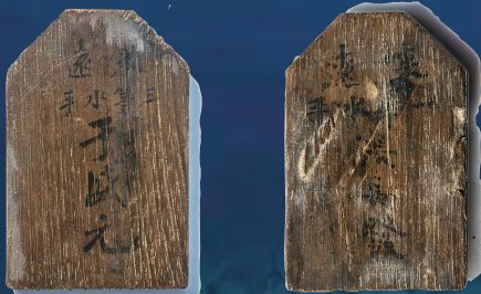
威海甲午沉舰遗址出水的来远舰水手身份牌