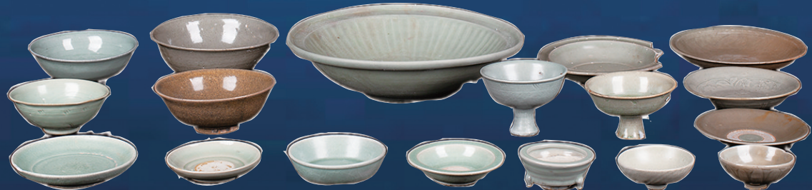
漳州圣杯屿元代沉船遗址出水的部分瓷器