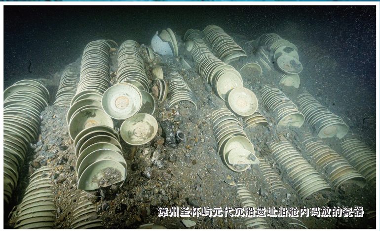
漳州圣杯屿元代沉船遗址船舱内码放的瓷器