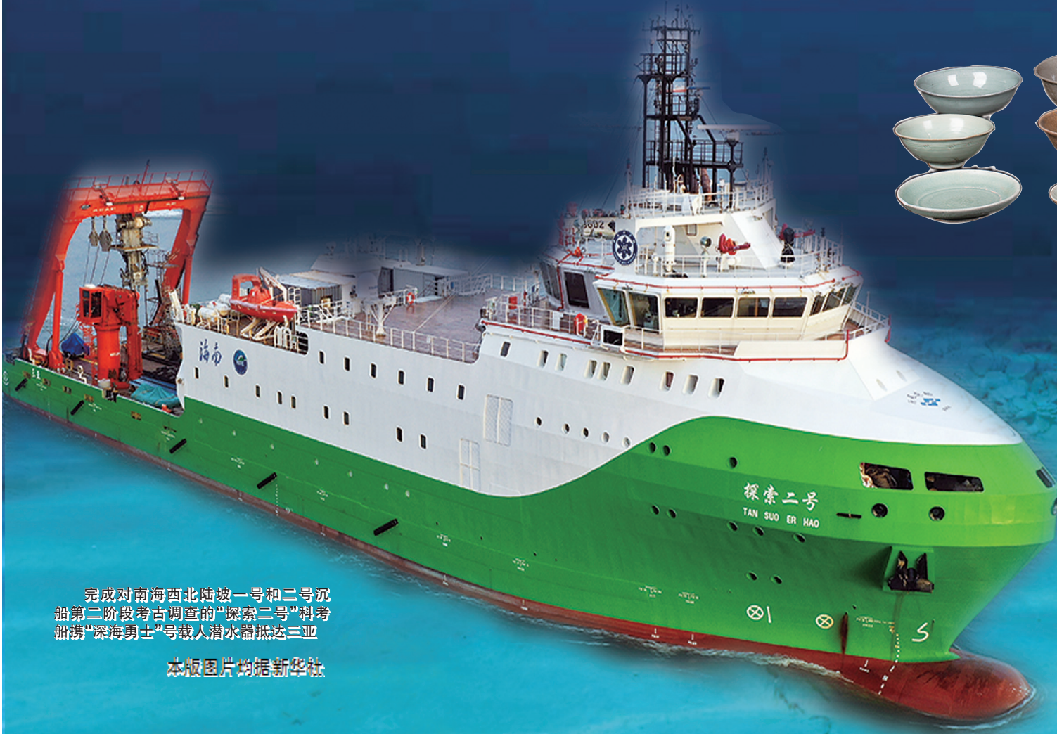
完成对南海西北陆坡一号和二号沉船第二阶段考古调查的“探索二号”科考船携“深海勇士”号载人潜水器抵达三亚