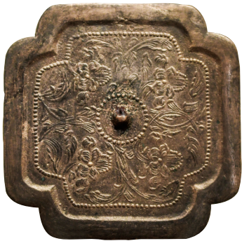
四花枝纹亚字形镜