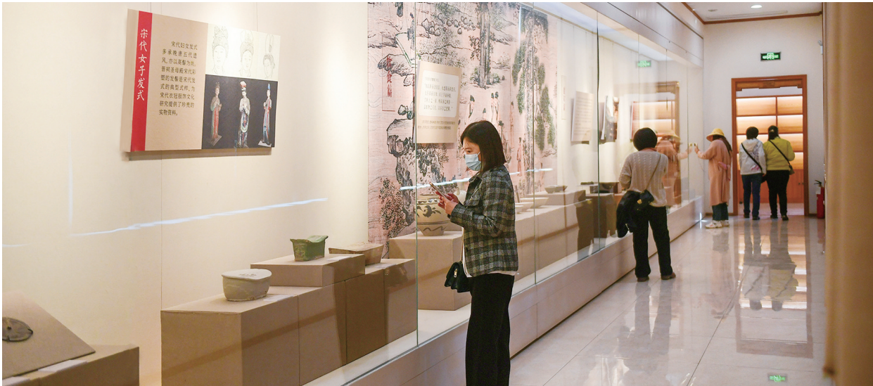
“宋之风——人间烟火”展厅