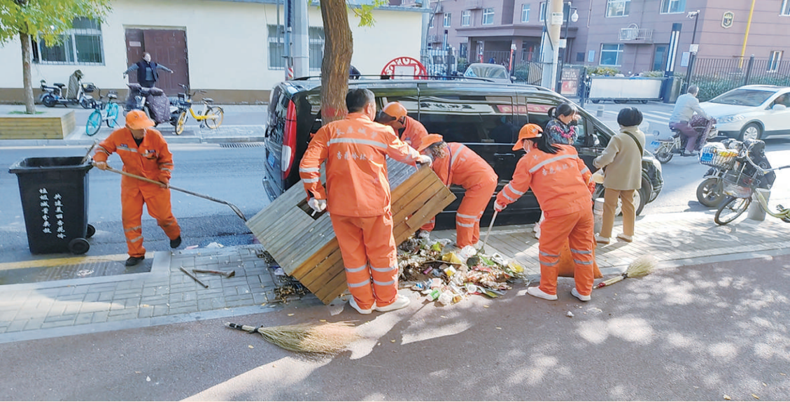
为助力全国卫生城市创建,10月30日上午,金刚里社区组织环卫人员和热心志愿者走进辖区小街巷开展卫生大扫除。大家拿着扫把、铁锹、垃圾袋,积极清理树坑里的杂物及街道卫生死角,清扫过的路面焕然一新。

的专职分类引导员,引导居民分类投放,从日常生活的点滴加强分类习惯的养成,推进生活垃圾分类的全民参与。”市人大常委会城建环保委负责人介绍。 通过此次检查,市人大常委会执法检查组建议,应完善收处设施建设,统筹分类体系提质增效;加大资金投入力度,完善垃圾处理收费方法;加强分类宣传教育,带动人人参与,提高群众参与广度深度。