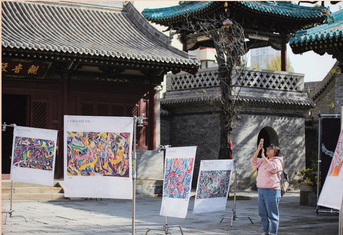
图为由市文物局主办的太原市文殊圣境文化艺术实践系列陈展现场。