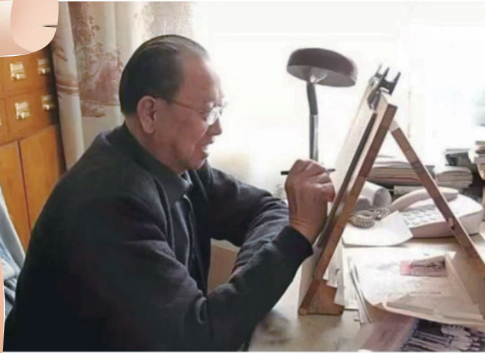
柴泽俊书桌前工作照。

柴泽俊是我国著名古建筑保护专家，为山西古建筑研究和保护作出卓越贡献。他从事古建筑的考查、研究和保护60多年，实地考察和研究过上千座古建筑实例，对古建筑的类型、构造特征及附属的壁画、塑像等的研究，都有很高造诣。他主持、指导和修缮了芮城永乐宫、五台山南禅寺、太原晋祠圣母殿等百余处古建筑。作为建筑保护理论、研究和实践相结合的特殊人才，2012年，山西省文物局授予柴泽俊“文博大家”荣誉称号。