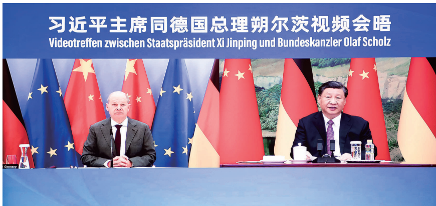
11月3日下午,国家主席习近平同德国总理朔尔茨举行视频会晤。