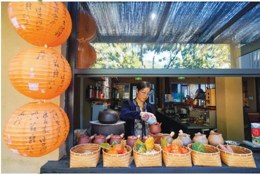
工作人员在树山村的一家民宿内为游客制作茶饮。

立冬已过，江苏苏州树山村仍披着一抹深绿。绿水青山间，天气晴好、风景如画的树山村吸引了大批游客到此休闲游乐，享受美好时光。