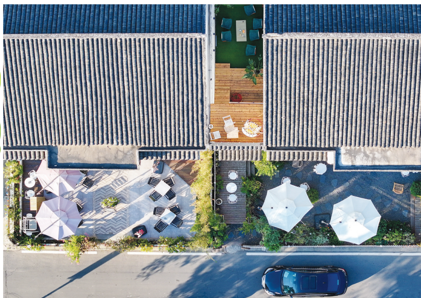
这是11月2日拍摄的树山村的民宿院落。