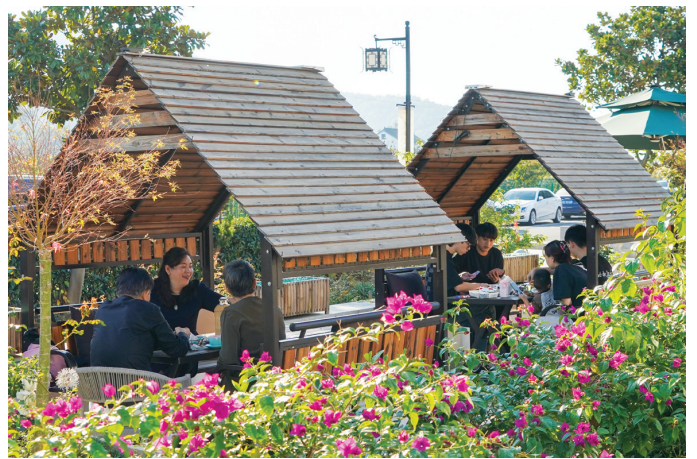
游客在树山村的一家民宿内休闲娱乐。