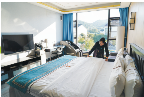
在树山村一处民宿，工作人员在整理打扫民宿房间。