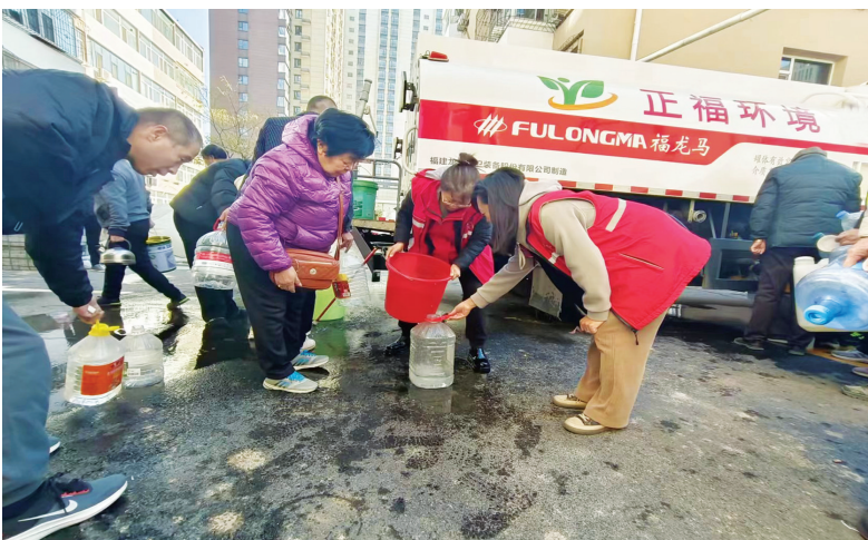
图为送水车驶入小区

在抢修的同时,社区迅速联系兴华街办环卫所,调派车辆临时供水,保障居民的生活用水需求。“大家不要急,排好队,一个一个来!”午时,送水车驶入小区,居民们拿着自备的水桶、盆盆钵