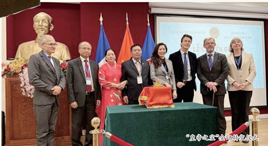
“皇帝之宝”金印移交仪式