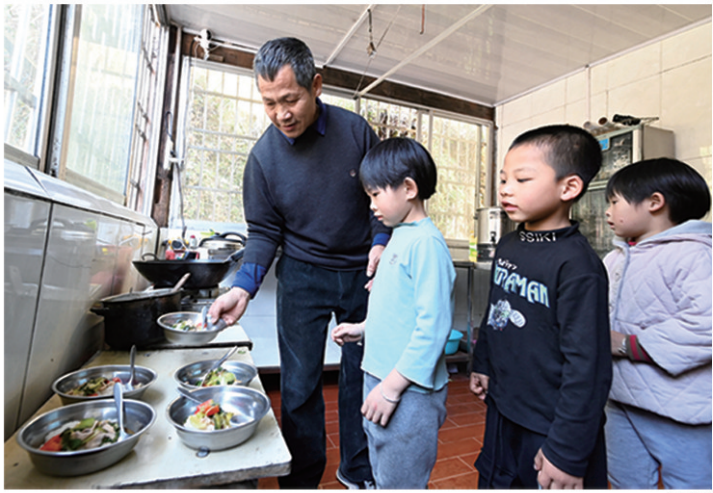
11月29日,潘从汉老师给学生分午餐。