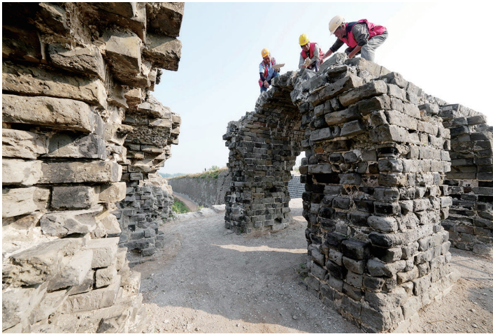
2023年6月15日，工人在山海关长城修缮工地施工。