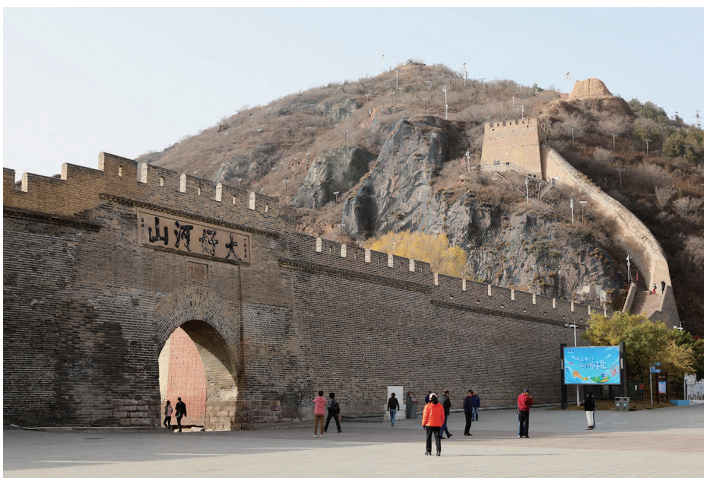
2023年10月31日，游客在张家口市大境门观光游览。

从山海关到嘉峪关，巍巍长城，犹如巨龙，“俯首”探海，“摆尾”大漠，“跃身”崇山峻岭，横跨万里山河，贯通千年文脉。