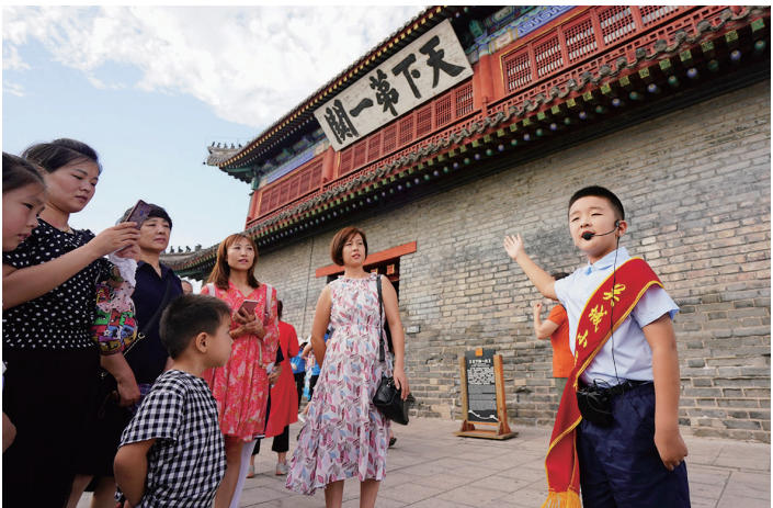
秦皇岛市山海关区“关城小导游”社会实践班的小导游(右一)在天下第一关城楼为游客讲解(2019年8月22日摄)。