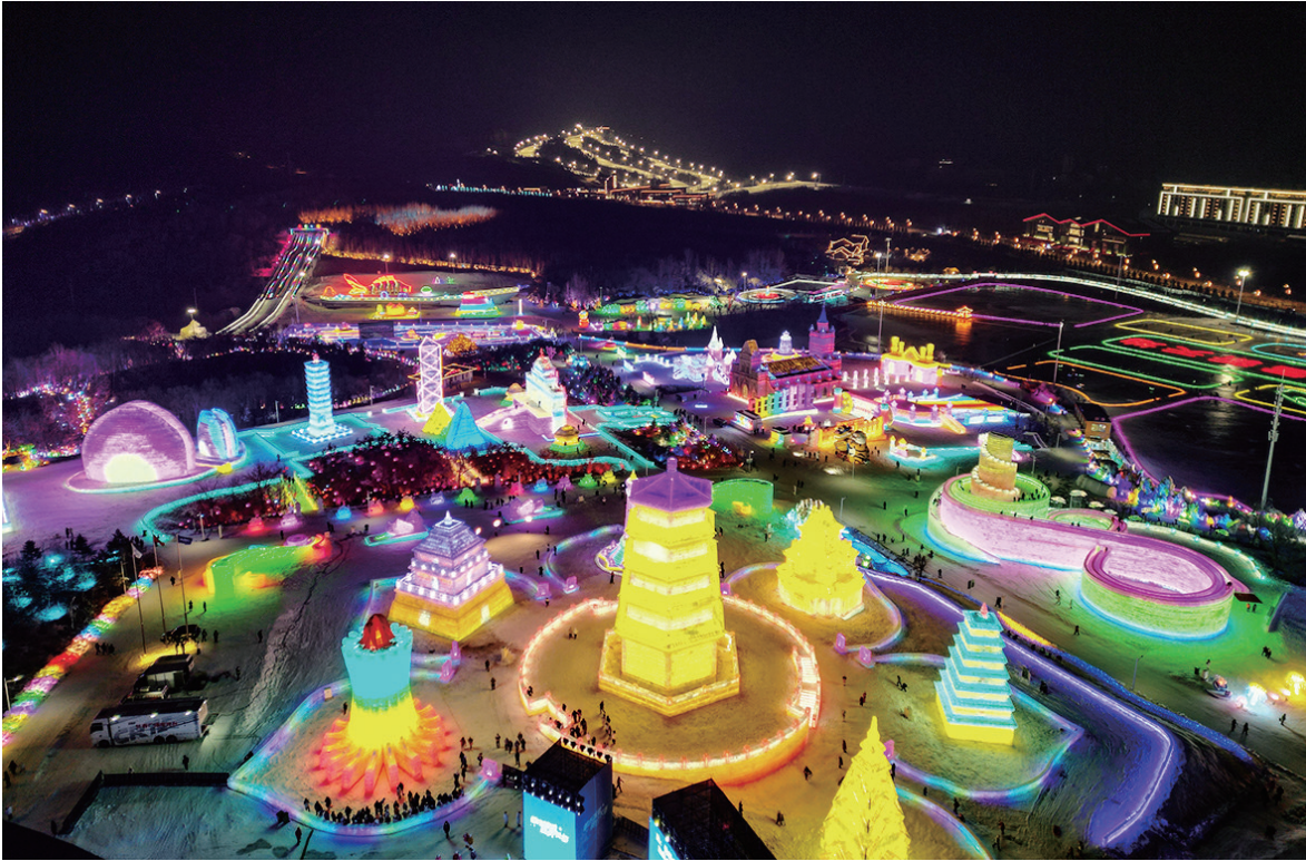
这是 12 月 12 日拍摄的长春冰雪新天地(无人机照片)。

新华社石家庄 12 月 12 日电 (记者 刘桃熊)记者从河北建投集团了解到,12 日,国家中长期铁路网规划项目邢和铁路正式开通运营。邢和铁路是晋冀中南区域一条新的能源运输通道,对进一步畅通晋煤外运、保障晋冀中南地区大宗物资运输需求、推动沿线地方经济发展具有重要作用。 邢和铁路全长 142.597 公里,全线新建 10 座车站,设计时速 120 公里,设计年货运能力 4000 万吨,线路西起山西省晋中市和顺县,东至河北省邢台市,与邯黄铁路联通,延伸到沧州黄骅港。 据介绍,邢和铁路开通运营后,不仅为山西中南部提供了便捷出海通道,还有效推进晋冀中南区域“公转铁”实施,对进一步完善我国华北地区铁路网布局,打造以黄骅港为枢纽的港铁联运、多式联运现代化物流体系具有重要意义。