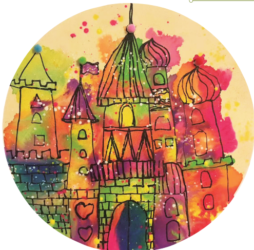
《梦幻城堡》 钟悦洋 绘