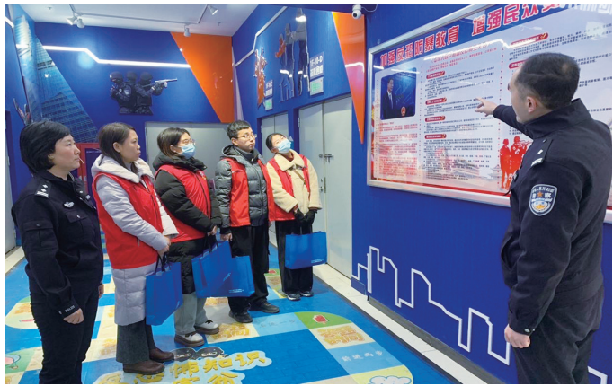
12月27日上午,在《中华人民共和国反恐怖主义法》颁布实施8周年之际,公安杏花岭分局在万达龙湖广场反恐工作宣传站组织开展“网格员反恐怖入站工作启动仪式”,公安杏花岭分局龙潭派出所、国保大队民警向网格员宣讲了反恐怖知识,发放了宣传资料,组织大家观看了宣教纪录片,开展了分组答题互动活动……将社区网格员力量纳入到实际工作,进一步增强全民反恐意识、国家安全观念。

袋一旦发生爆炸或泄漏,使用者不仅会被烫伤,还很可能会触电。 市民购买电热水袋,应注意在正规商家购买正规厂家生产的产品,产品必须具有国家3C认证和产品合格证,布料应选用防火面料。还要检查电热水袋密封是否完好,电源线是否完好无损,电源线接口是否有裂纹或其他安全隐患等。使用热水袋时,要注意防范烫伤意外。市民使用时用手感觉表面不烫为宜。给老人及婴幼儿使用时应避免直接接触皮肤,应额外添加毛巾或棉布,避免烫伤事故发生。使用热水袋保暖时,不要将其放在腰部或其他身体部位用力挤压。如果使用过度或对电热水袋产生超负荷的压力,有可能引发充电热水袋爆裂。