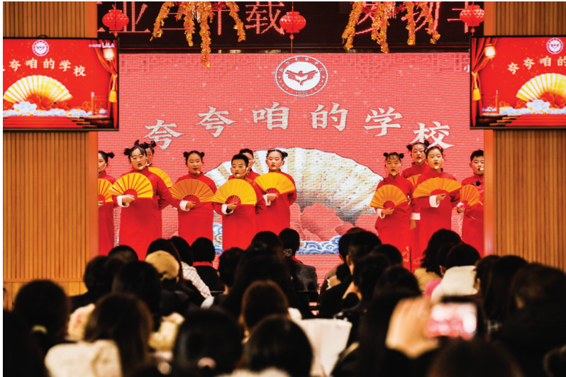
12月28日,新力惠中学校举办建校30周年庆祝活动。太原晚报小记者用自编自演的节目感恩母校的培育。王韵菲 摄