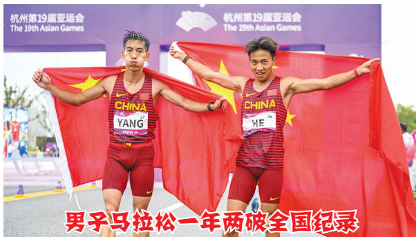
男子马拉松一年两破全国纪录

9 月 23 日至 10 月 8 日,杭州第十九届亚洲运动会举行。中国体育代表团获得 201 枚金牌,取得亚运会参赛历史最好成绩,连续第 11 次位居亚运会金牌榜榜首。10 月 22 日至 28 日,杭州第四届亚残运会举行。中国体育代表团获得 214 枚金牌、521 枚奖牌,连续四届位列金牌榜、奖牌榜双第一。