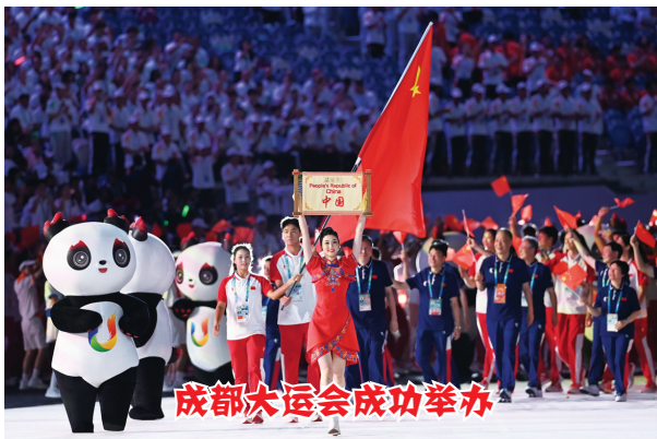
成都大运会成功举办

7 月 14 日至 30 日,世界游泳锦标赛在日本福冈举行,中国跳水、花样游泳和游泳总计获得了 20 枚金牌、8 枚银牌和 12 枚铜牌,金牌数名列第一。其中覃海洋夺得男子 50 米、100 米和 200 米蛙泳冠军,成为历史上首位在一届世锦赛包揽蛙泳三金的选手,他还打破了男子 200 米蛙泳世界纪录。此后的世界杯赛中,覃海洋荣膺男子年度总冠军。