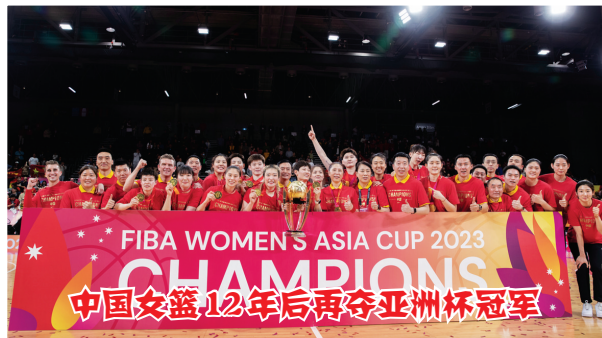
中国女篮 12 年后再次夺得亚洲杯冠军

2023 年,足球、篮球、龙舟等群众体育活动在全国掀起热潮,和美乡村足球超级联赛、和美乡村篮球大赛以及湖南、广东等地的龙舟赛让乡村体育成为亮点。