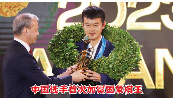
中国选手首次加冕国际象棋王

2 月 11 日,中国体育仲裁委员会在北京成立,标志着《体育法》规定的体育仲裁制度成为现实。截至 11 月,中国体育仲裁委员会已依法依规完成第一批体育仲裁案件、共计 3 件的受理审理工作。相关仲裁实践通过体育仲裁及时、公正地解决体育纠纷,有效化解矛盾,有效维护《体育法》的严肃性和体育仲裁制度的公信力,有利于营造体育事业发展的良好环境,为新时代加快推进体育强国建设保驾护航。