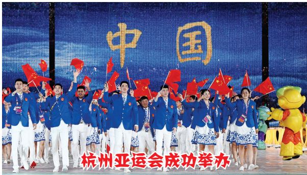
杭州亚运会成功举办

7 月 28 日至 8 月 8 日,第三十一届世界大学生夏季运动会在四川省成都市举行。国家主席习近平出席开幕式并宣布本届大运会开幕。本届大运会吸引了来自 113 个国家和地区的 6500 名运动员参赛,中国体育代表团名列金牌榜和奖牌榜首位。