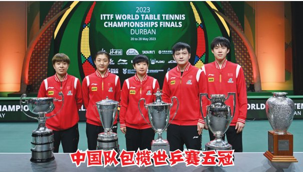
中国队包揽世乒赛五冠

4 月 30 日,在哈萨克斯坦首都阿斯塔纳举行的 2023 年国际棋联国际象棋世界冠军赛中,中国棋手丁立人在快棋加赛的最后一盘战胜俄罗斯棋手涅波姆尼亚奇,成为第一位来自中国的国际象棋世界棋王,也成为国际象棋历史上第 17 位世界冠军。