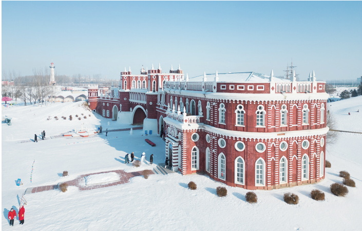
1月7日，游客在哈尔滨伏尔加庄园内游玩。