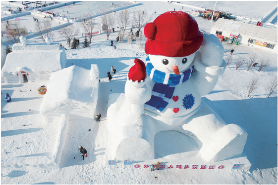
1月9日，游客在哈尔滨外滩雪人码头游玩。

最近，“冰城”哈尔滨旅游市场火爆。冰雪大世界、太阳岛雪博会、冰灯艺术游园会……这些厚实的冰雪“家底”撑起冰雪浪漫之都的门面。让我们一起飞阅冰城“尔滨”，一睹正在这里上演的冬季旅游“冰与火之歌”。