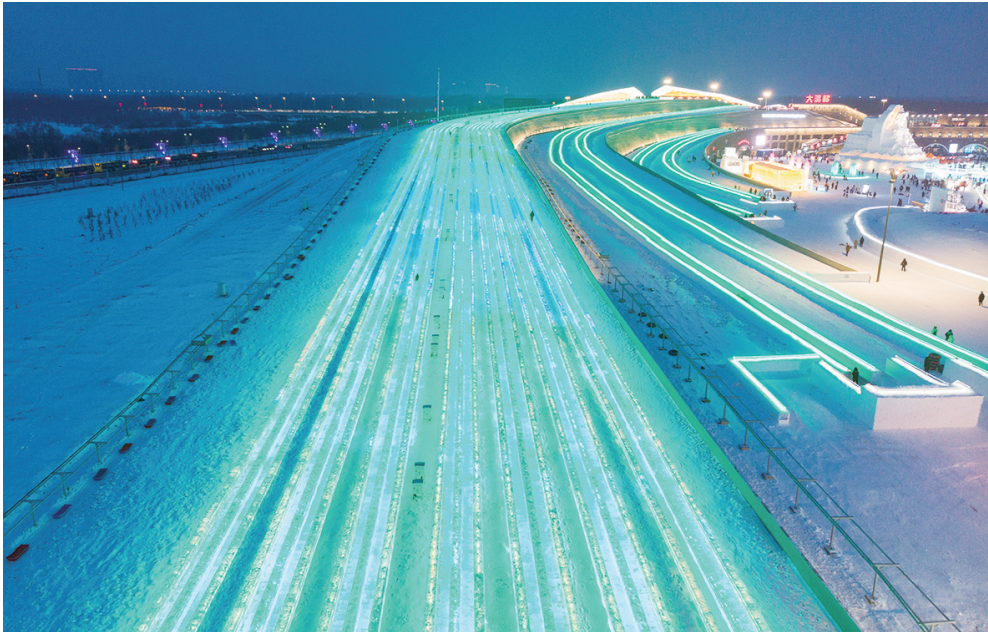
1月1日，游客在哈尔滨冰雪大世界园区体验超级冰滑梯。