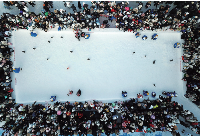
1月5日，游客在哈尔滨极地公园广场观看企鹅巡游。