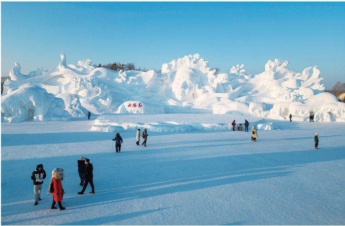
1月9日，游客在哈尔滨太阳岛雪博会区内游玩。

最近，“冰城”哈尔滨旅游市场火爆。冰雪大世界、太阳岛雪博会、冰灯艺术游园会……这些厚实的冰雪“家底”撑起冰雪浪漫之都的门面。让我们一起飞阅冰城“尔滨”，一睹正在这里上演的冬季旅游“冰与火之歌”。