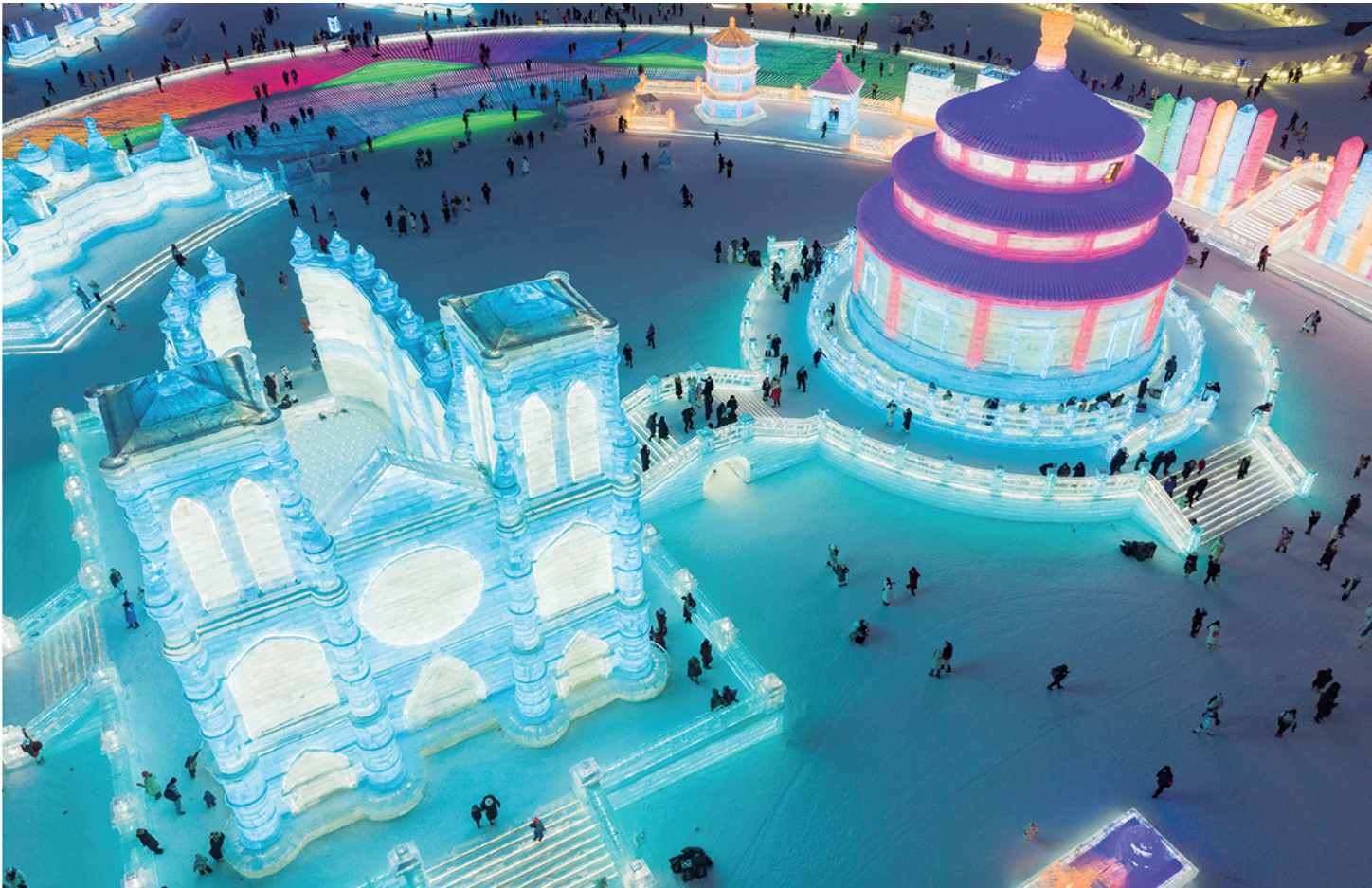
这是1月1日拍摄的第25届哈尔滨冰雪大世界园区中的巨型冰雕景观。