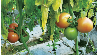
即将成熟的普罗旺斯西红柿。