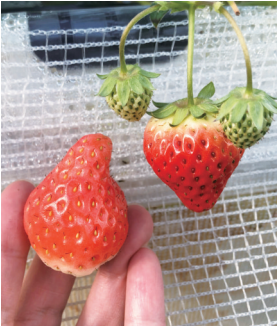
左为“章姬”右为“红颜”。

体验导览: 王吴村草莓小镇往东大约200米,就到了第二个园区。眼前一座面积为6000平方米的玻璃大棚,令人充满好奇。 五六米高的温室大棚里,室温大约23摄氏度,体感适宜,采光和流通性很好。种植区域干净整齐,草莓都“长”在一排排架子上,架子上铺满火山岩石,给草莓“补充”微量元素。 “红草莓其实也各有差异。比如这个‘章姬’,