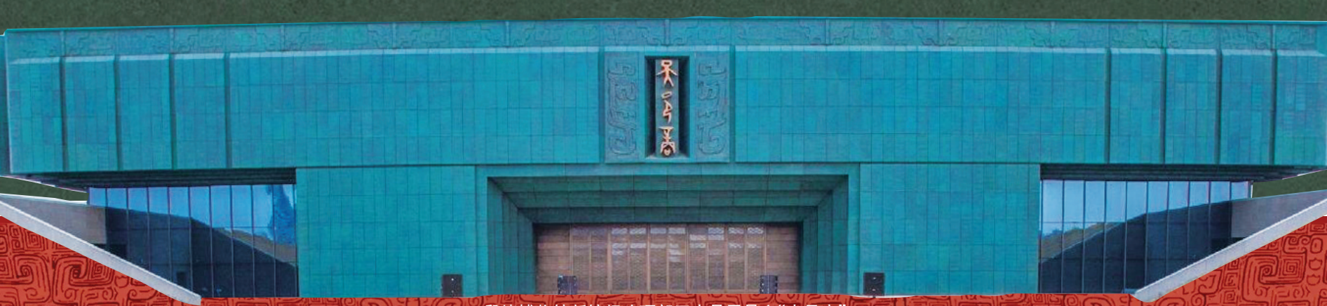
殷墟博物馆新馆门头顶部正中是甲骨文“大邑商”