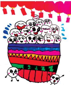
《甜蜜的元宵》 康书萱 绘

联映入眼帘:“纯洁无染之谓清,诚一不二之谓真”。走进店里,青灰色的砖砌石柱、暖黄色灯光的古典吊灯、木质桌椅,让人感觉特别温馨,店里有一整面墙记载着“认一力”的美味传承:这是一家具有特色的清真饭店,创建于1930年。 店员端来了饺子,我和妈妈津津有味地吃起来,果然味道鲜美,口齿留香,真不愧是百年名店!