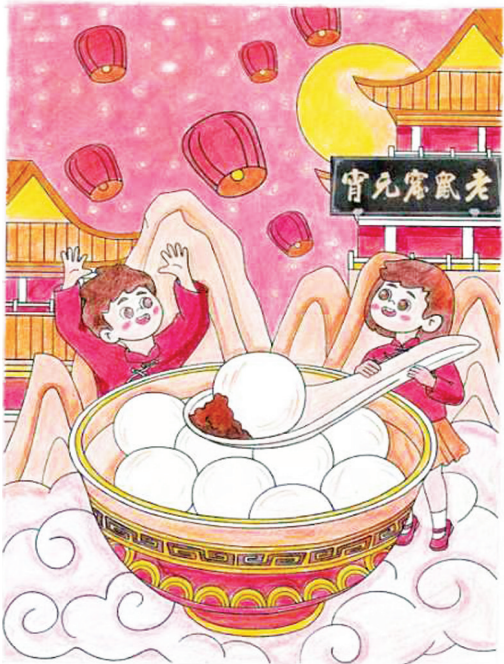
《老鼠窟元宵》 陈锦航 绘