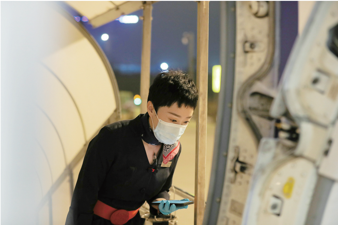
飞行前检查应急设备