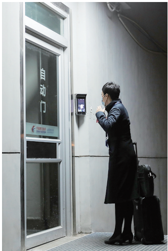
通过面容识别进入运行大厅