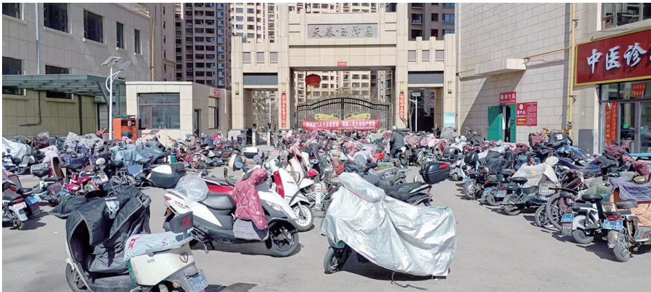
天泰玉泽园小区从入住之初,就禁止电动自行车进入,居民们将车辆有序停放在南门外空地。

就此,记者走访一些小区发现,有些物业近年来一步步规范电动车管理,禁止“飞线”充电,禁止“电驴”进电梯等措施已明显见效,还有些物业则比《条例》规定“走得还远”,已禁止电动自行车进入小区,有的是由来已久,有的则是“新鲜出炉”。对此,多数居民表示赞成,尤其一些此前就禁入“电驴”的小区,居民已渐成习惯。也有的居民希望在消除安全隐患的同时做好配套服务,方便“电驴”使用。