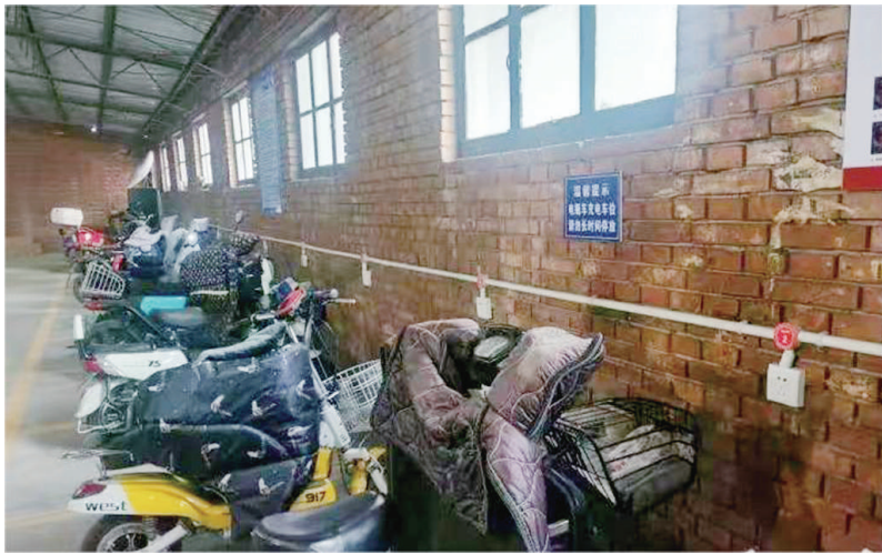
大东关社区新改造的车棚增加了充电功能,彻底改变居民“飞线”充电的陋习。