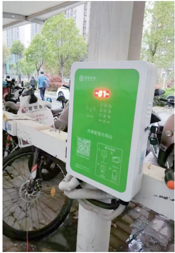
某品牌电动自行车智慧共享充电站,按照时间收费,每次从几毛钱到一两元不等。

3月18日上午10时许,记者在万柏林区下元二小区A区看到,5栋高层建筑前都划着停车区域,摩托车、电动自行车、自行车有序停放。随便走入其中一栋,沿安全通道往上走到5楼,没有看到一辆电动自行车。“前些年没人管,经常有人把车推进楼道里,甚至有人推回家里充电,后来施行《高层民用建筑消防安全管理规定》,消防查得严,物业就不让放了,如果放楼道或上电梯,要罚款呢!”一居民表示,转变之初他们也觉得不方便,但广泛的消防安全宣传还是让大家意识到了事情的必要性。后来,小区专门划出停车区域,再后来又加装了雨棚,方便了也就习惯了,“现在电动自行车禁入楼宇、禁入电梯,已经成了居民们的共识。”