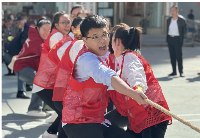
网络趣味运动会现场。

本报讯(记者 周利芳 通讯员 刘雪婷 文/摄)3月30日,在龙保社区开展的首届社区网络趣味运动会上,社区网格员、居民们个个化身“运动健将”,在激发拼搏精神、促进邻里交往的同时,也享受到趣味运动带来的乐趣。