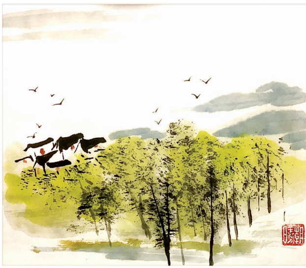
春到汾河 张朝曦 绘