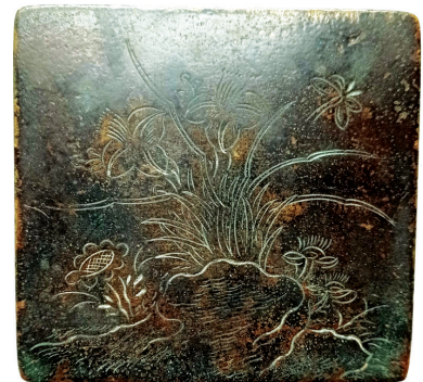
“兰花石”正方形铜墨盒

精刻苍劲的古松和一只站立在松树上低头注视着灵芝的仙鹤。松是“百木之长”，鹤为“百羽之宗”，灵芝素有“仙草”之称，松鹤组合寓意福寿绵长。