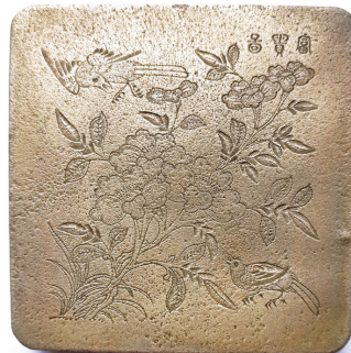
“富贵图”正方形铜墨盒

春回大地，鸟语花香，正是踏青赏花的好时节。刻铜名家以铜为纸，以刀为笔，在铜墨盒上雕刻花鸟，寄托志愿，留住美好。