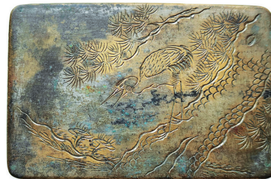
“松鹤延年”长方形铜墨盒

盒面被长方形框分割为内外二部分，就像是在某个建筑上开了一扇窗，使得主题更加突出。窗外依山傍水的几间房屋，右下角一位老者独自划着小船正向房屋靠近。窗内，春柳萌发出嫩芽，柔软如丝，婀娜多姿。右下角鲜花盛开，吸引蝴蝶飞来。整幅画面布局合理，疏密有致，极具美感。