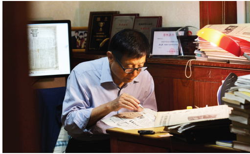
修复破损报纸，需要细心加耐心。