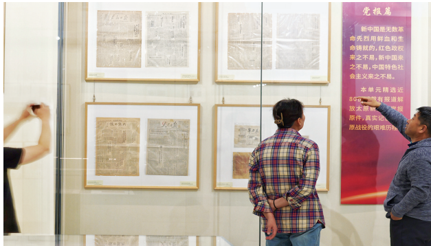
藏品展上，载有报道解放太原新闻的党报报刊原件，真实记录了那段波澜壮阔的历史。