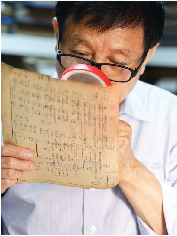
视若珍宝的旧报纸。