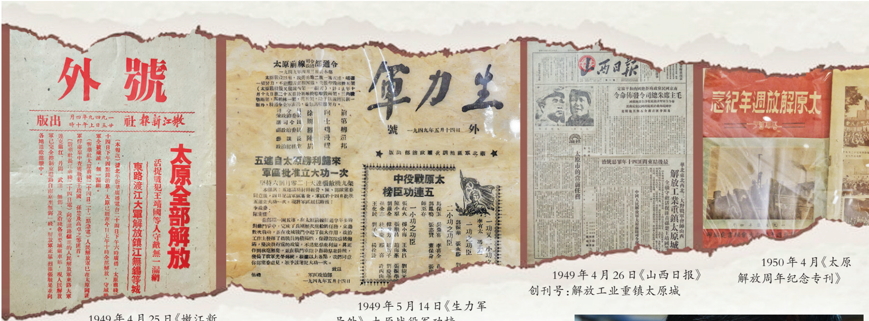
1949年4月25日《嫩江新报号外》：太原全部解放