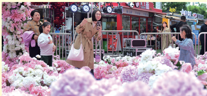
万达广场,其乐融融