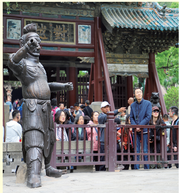
晋祠博物馆,游客爆棚