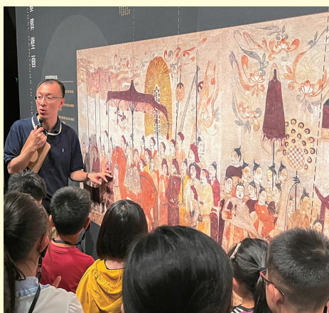
太原北齐壁画博物馆,一眼千年