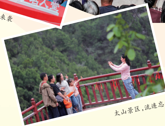
太山景区,流连忘返