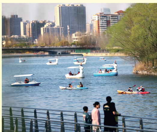
汾河景区,碧水轻舟