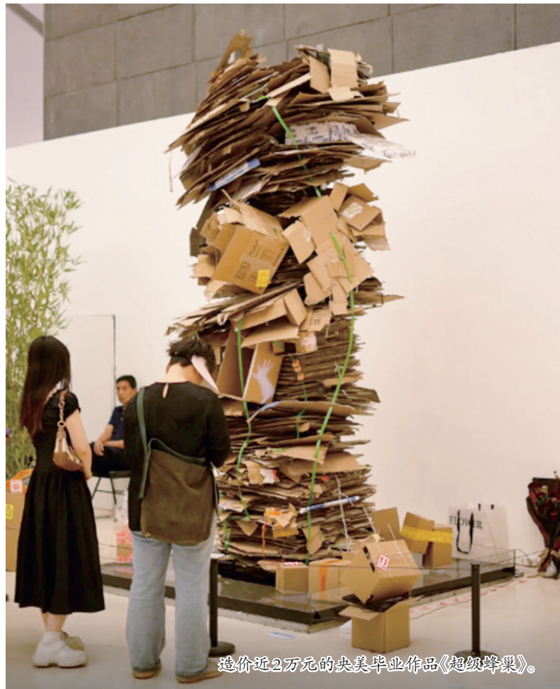
造价近2万元的央美毕业作品《超级蜂巢》。

展会期间,观众络绎不绝,感叹于博物院文创产品背后的文化内涵,引起对山西文化的好奇与热爱。截至目前,山西博物院深入挖掘馆藏文物资源,通过IP授权、自主研发、合作开发等形式,形成涵盖9个大类、20余个系列、1500余款文创产品矩阵。