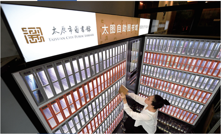
安居公寓大厅配备“太图自助图书馆”方便大家借阅。