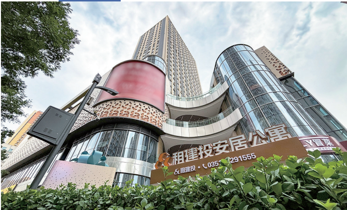
人才公寓大多位于市区,交通便利。