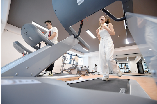
租建投并州帝景安居公寓设有书吧、健身房等配套设施,满足入住者多元需求。