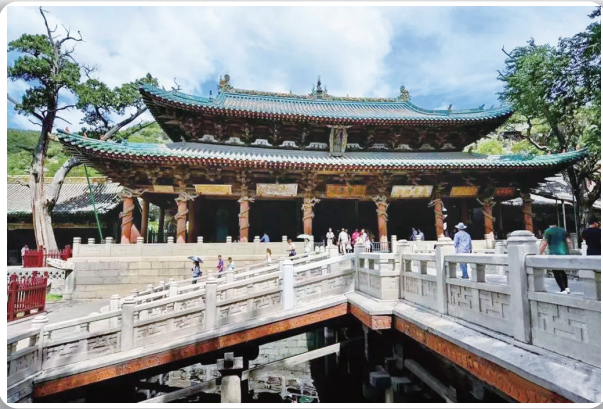
晋祠鱼沼飞梁(资料图片)

(984)。大殿的梁架采用了“乳枅对六椽枅用三柱”形式，这是我国现存古代建筑中唯一符合《营造法式》殿堂式构架形式的孤例，而《营造法式》又是我国目前发现的最早建筑专用书。