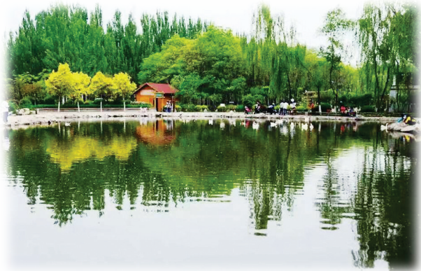
南寨公园