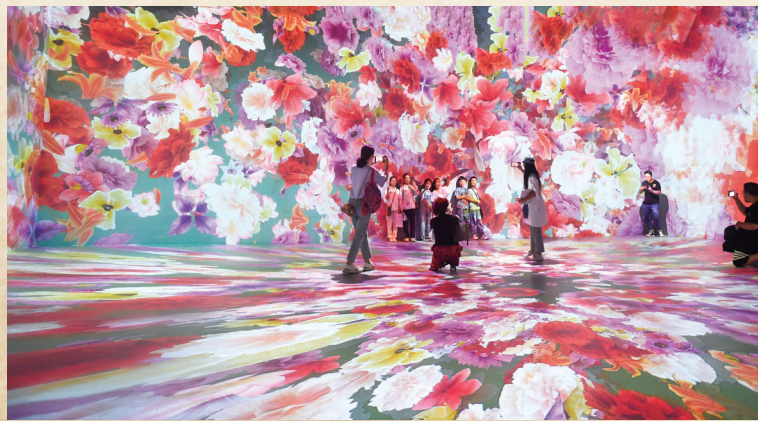
沉浸式互动观影展厅——“光影丹青”

流畅的线条,勾画着人生态理想;写意的水墨,描绘出秀美山河;典雅的色彩,映衬着盛世气象。