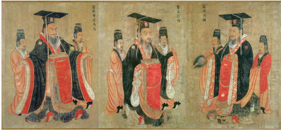
《历代帝王图》(局部) 唐 阎立本