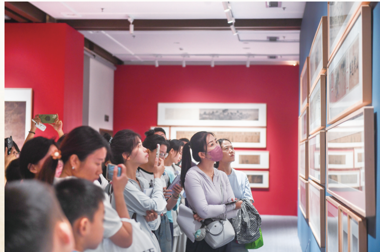
“盛世修典——‘中国历代绘画大系’成果展山西特展”吸引了众多观众