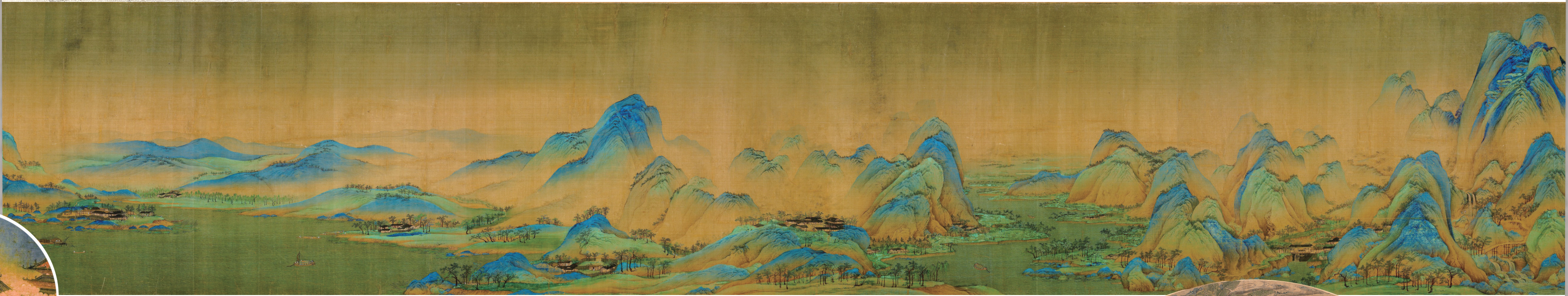
《千里江山图》(局部) 宋 王希孟