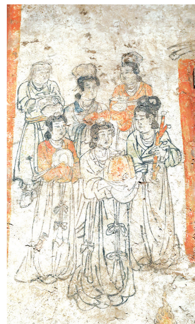
山西省繁峙县南关村壁画墓(局部)