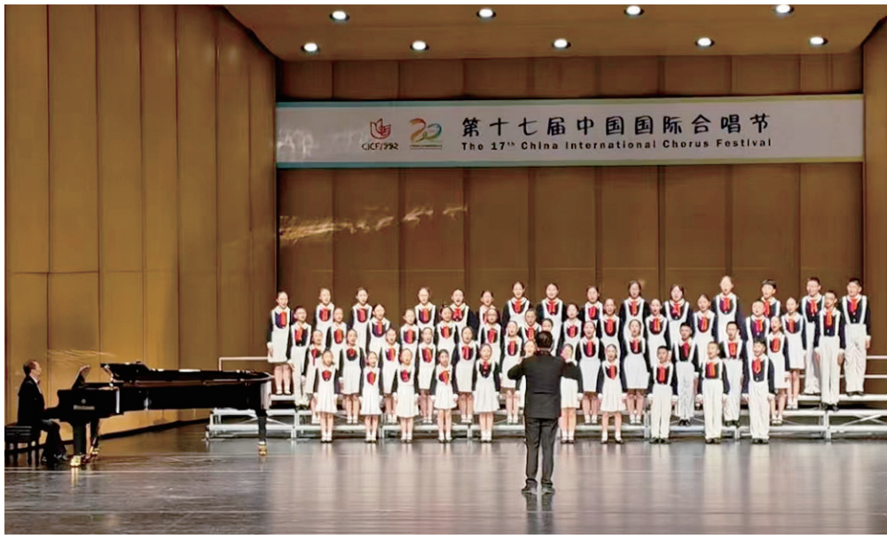
小黄鹌合唱团的孩子们倾情演唱。

本报讯(记者 王勇 通讯员 杜飞 文/摄)在第十七届中国国际合唱节颁奖典礼上,迎泽区少年宫小黄鹌合唱团凭借出色的表演,获得童声组“一级团队”荣誉称号。这是7月24日从迎泽区少年宫传来的好消息。