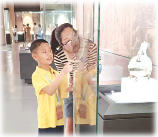
图为作者为游客讲解

这个夏天,很多游客来山西旅游。作为一名小学生,我满心期待向游客们介绍山西青铜博物馆,因为这里珍藏着山西深厚的历史文化瑰宝。