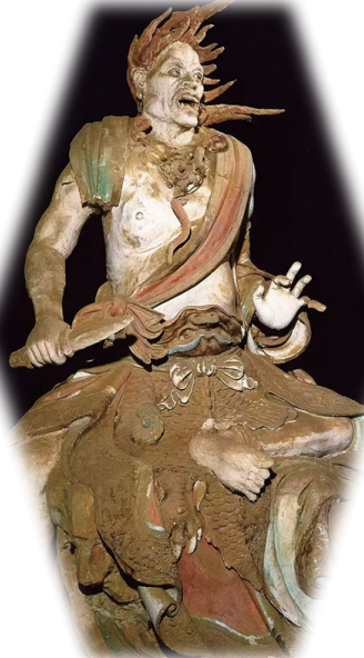
二十八宿彩塑之室火猪（资料图）

化身二十八位人物，造型生动，栩栩如生。每一尊彩塑都独具特色，有的威武雄壮，有的温婉动人，有的神秘莫测，服饰和神态刻画得极为细腻传神。这些彩塑之精美，实属罕见，是我国古代道教雕塑艺术的巅峰之作，堪称国之瑰宝。