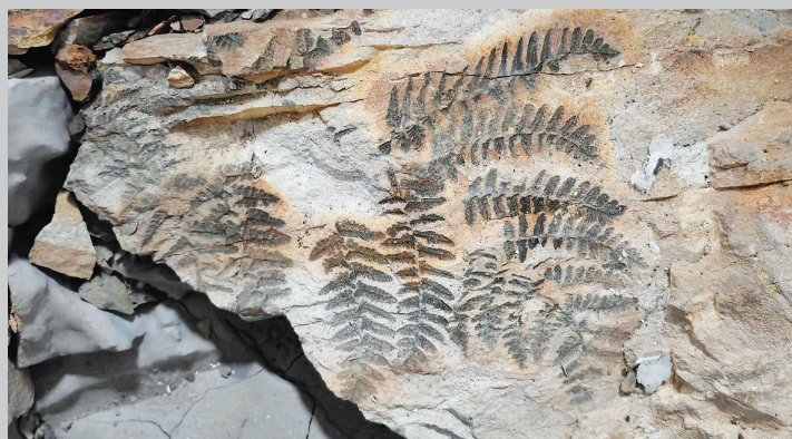
这是乌海市海勃湾区博物馆收藏的植物化石(9月1日摄,手机照片)。